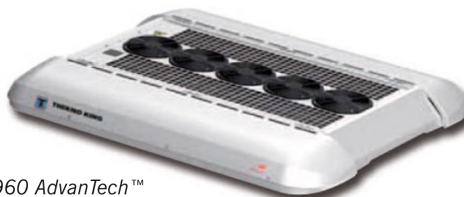
S 960 AdvanTech™